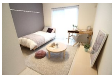
※同タイプ他部屋(モデルルーム)のお写真です ※現況優先